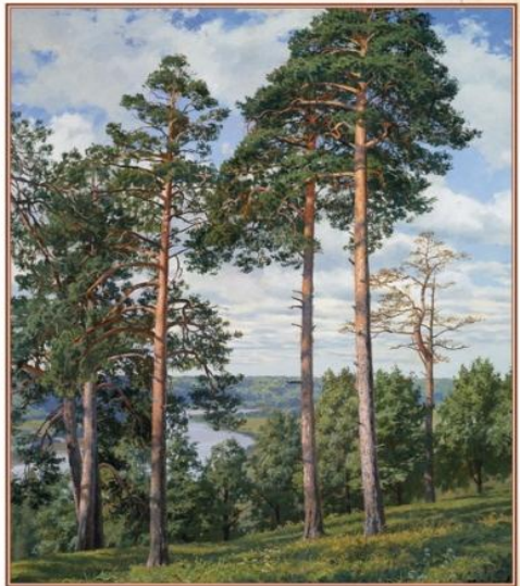
Андрей Герасимов. Сосна Окаймленная

В результате исторических исследований, проведенных в южной Европе, было установлено, что славяне возникли из южно-восточной Европы, и что они в конечном итоге превратились в славянство. Но слово «славяне» — это название некой культуры, которая существовала в южной Европе, и которая в конечном итоге превратилась в славянство.