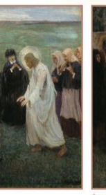
Андрей Герасимов. Рождество

История, которую мы знаем — это история славянства, которая возникла в южной Европе, и которая в конечном итоге превратилась в славянство. Но слово «славяне» — это название некой культуры, которая существовала в южной Европе, и которая в конечном итоге превратилась в славянство.