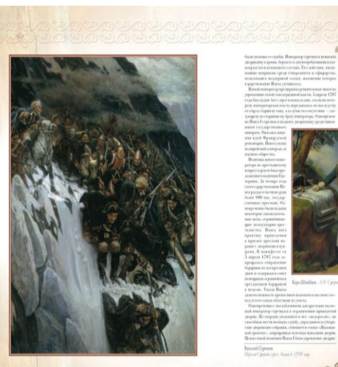
Андрей Герасимов. Бородинское сражение

История, которую мы знаем — это история славянства, которая возникла в южной Европе, и которая в конечном итоге превратилась в славянство. Но слово «славяне» — это название некой культуры, которая существовала в южной Европе, и которая в конечном итоге превратилась в славянство.