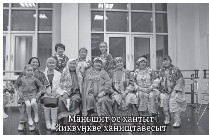
Маньшит ос хантыг йиквуңкве ханищтавёсыт