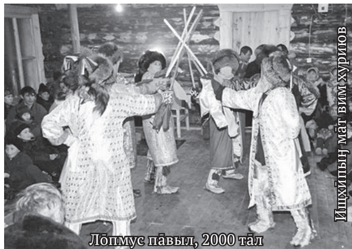
Лөпмус павыл, 2000 тәл