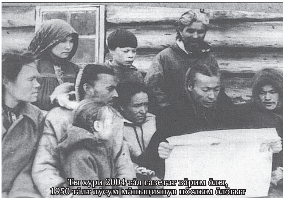
Ты хури 2004 тҘл газетат вҘрим Ҙлы, 1950 тҘлт лҮсум мҘнҘщиянҘв пҘсылм ҘлҘгыт