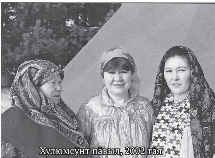
Хулюмсүнт павыл, 2002 тәл