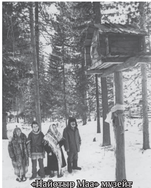
«НҘйотыр Маа» музеит