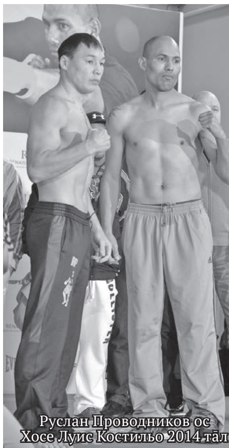
Руслан Проводников ос Хосе Луис Кастильо 2014 тәл