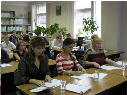
Городской конкурс «Слово—мир», 2013