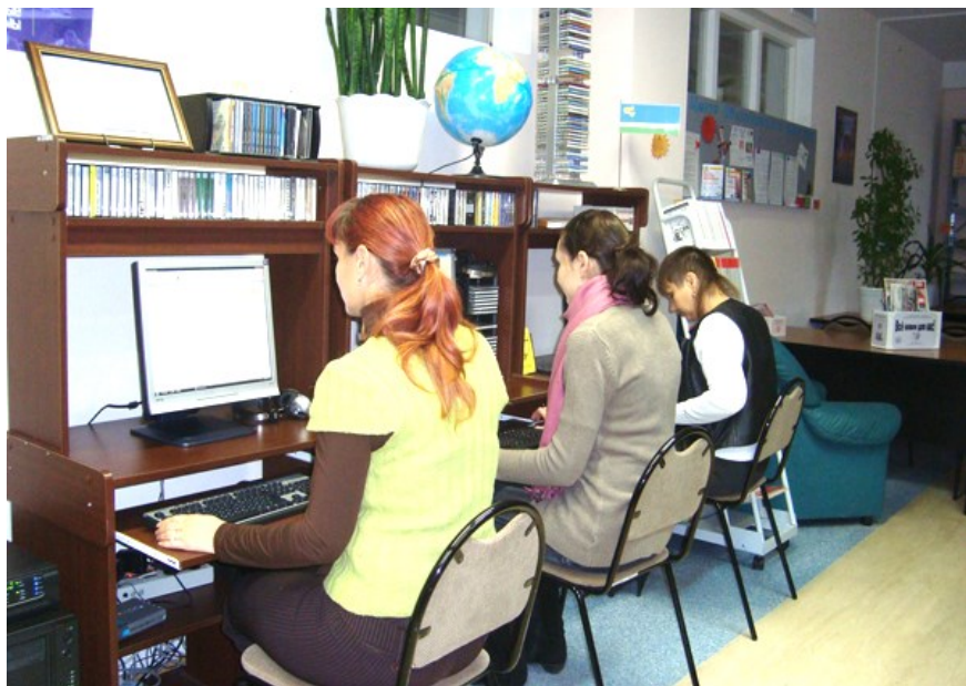
Центр общественного доступа в Центральной городской библиотеке

В 2002 году “Библиотечно-информационный центр” получил статус муниципального учреждения. Теперь библиотека - самостоятельное учреждение.