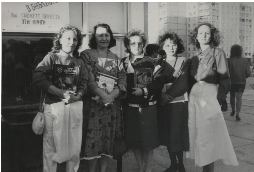
Библиотекари Центральной городской библиотеки

На начало 1992 года Лангепасская централизованная библиотечная система состоит из Центральной городской библиотеки и 5 филиалов. Стали активно сотрудничать с творческими коллективами города, с коллективами художественной и музыкальной школ. Итогом сотрудничества стали созданные на базе филиалов клубы: “На крыльях Парнаса”, “Домовенок”, “Литературный час” и другие. Старались уходить от политических тем, особое внимание уделялось краеведению, домоводству, естественным наукам.