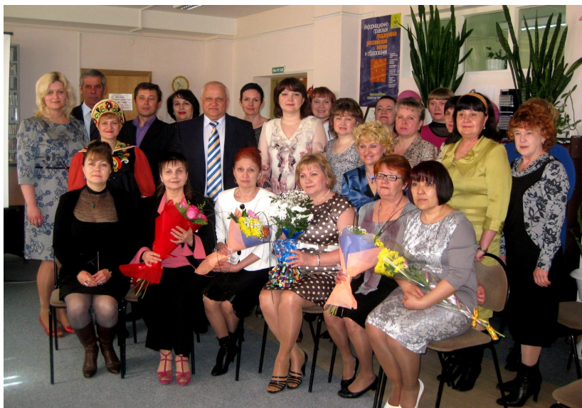
27 мая—Общероссийский день библиотек, 2013 г.

На сайте библиотеки запустили три новых проекта: «Созвездие Дружбы», «Абонемент отраслевой литературы» и «Духовная поэзия». Уверенно войдя в телекоммуникационное пространство Интернета мы уже