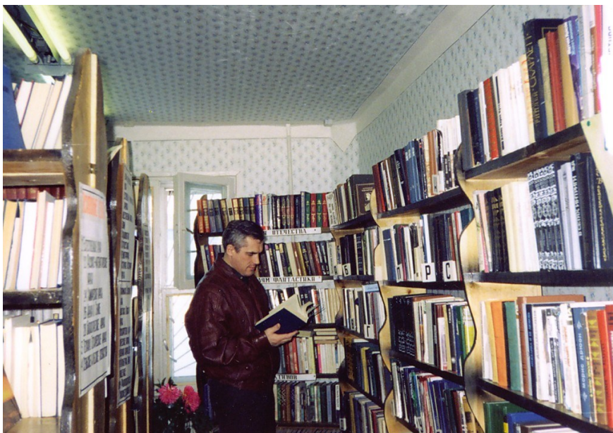
Читатель библиотеки-филиала №3

Недостаток книг восполняли периодические издания. В них можно было найти информацию, необходимую читателю. Поэтому библиотекари подробно расписывали статьи из газет и журналов.