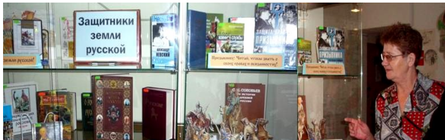
Книжная выставка: “Защитники земли русской”