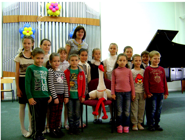
Стершенок Конда в Лангепасе, 2015 г.

В конце 2015 года была проведена реорганизация муниципального учреждения «Центр культуры «Нефтяник» путем присоединения к нему Музея и Библиотечно-информационного центра.