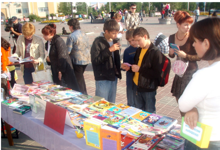
Выездная книжная выставка, посвященная Дню города

В последнее время в информационной деятельности библиотеки стали появляться новые термины: фашизм, терроризм, экстремизм... Грозно? Страшно... Но сегодня - это действительность современного общества. И библиотека позиционирует себя как территория толерантности, имеющая уникальную возможность вести убедительный рассказ с помощью книги о культурах, традициях и обычаях разных