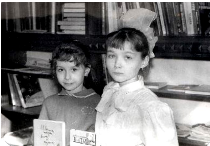
Читатели детской библиотеки

Библиотеку разместили в жилом доме четырехкомнатной квартиры. Первая заведующая детской библиотекой Железняк Е.В. вспоминает: “Мы всё начинали с нуля: от сварки стеллажей до формирования книжного фонда. Книги нам присылали из Нижневартовска, Белоруссии, Москвы. Игрушки для детского зала закупили на “большой земле” будучи в отпуске. Посещаемость библиотеки была огромная, т.к. это была единственная библиотека для детей. Приходили семьями, ведь кроме клуба, в то время и ходить некуда было”.