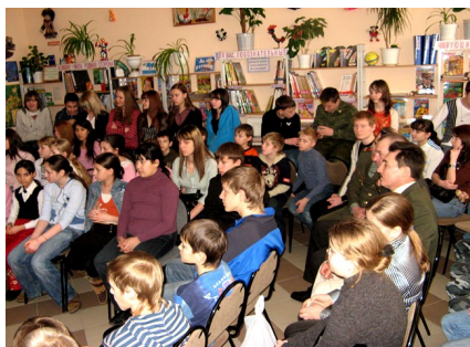
Встреча школьников с ветеранами боевых действий в Афганистане