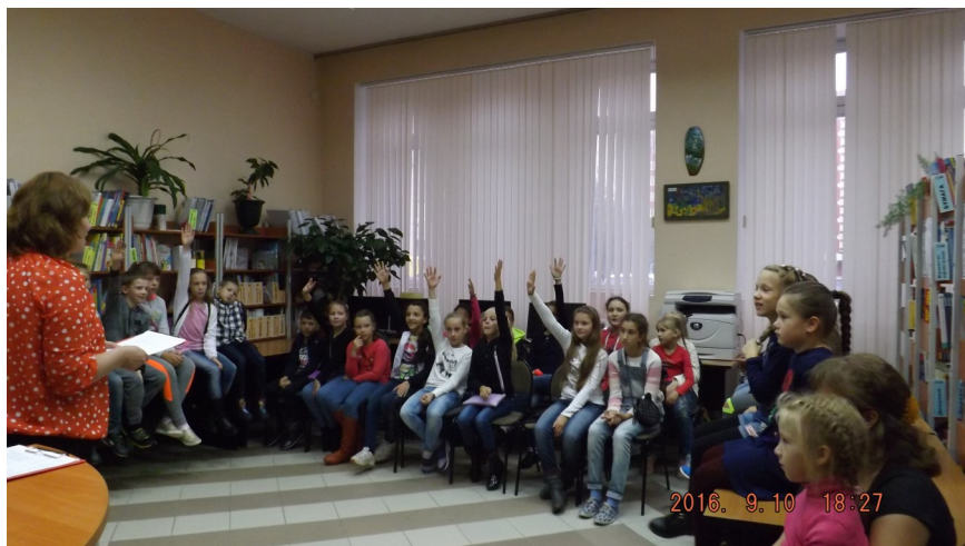
Библиоплощадка «Мы и город», 2015 год

Библиотечные мероприятия приобрели заслуженную славу и масштабность. Если Масленица, то с размахом на несколько детских садов и вкусными блинами (может, дело в блинах?). Если день рождения города, то целая библиоплощадка «Мы и город», собравшая в первый год