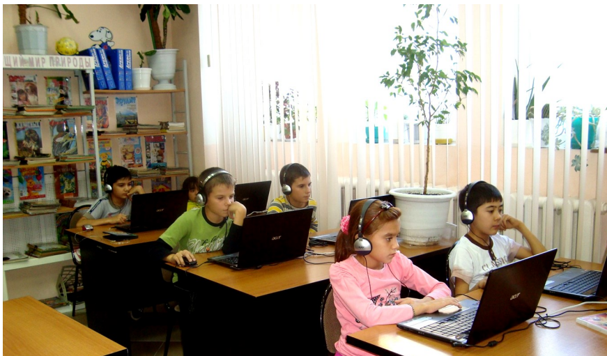
Читальный зал-медиаотека в Центральной детской библиотеке

Для сотрудников и читателей ЦГБ в рамках работы “Центра общественного доступа”, проводим мероприятия для подростков и молодежи по следующим направлениям: правовой культуре, антифашистской направленности, воспитанию толерантности, устранению террористической деятельности.