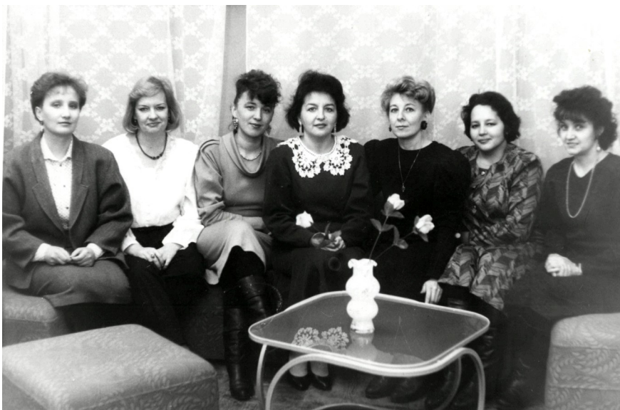
Коллектив Центральной городской библиотеки

Невозможно было сразу понять все перемены, разобраться в них. Многие казались ошибочным, преждевременным, лишним. Проводились обзоры новой литературы, жаркие дискуссии по вопросам политики. Необычайно популярными стали темы по вопросам истории: последних дней жизни Ленина, красном терроре, годах репрессий, личности Сталина и его окружении. Библиотеки знакомили читателей с новыми материалами периодики о руководителях советского государства Н.С. Хрущёве и “хрущёвской оттепели”, Л.И. Брежнев и годах застоя. Позднее появились и обсуждались материалы о политическом противостоянии М.С. Горбачёва и Б.Н. Ельцина.