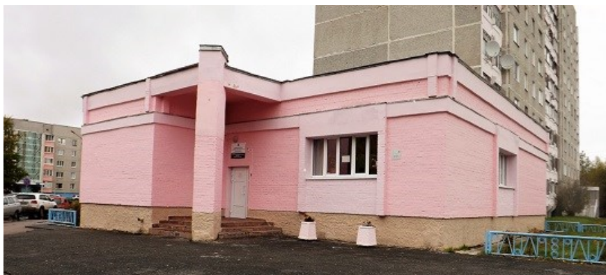
Здание Филиала №1, 2013 г.

С момента создания электронного каталога библиотекари стали задумываться об электронной книговыдаче. Этот новый шаг не только ускорит ежедневную работу библиотекаря, но и упростит для читателя пользование библиотекой, приблизит его к книге. Новые