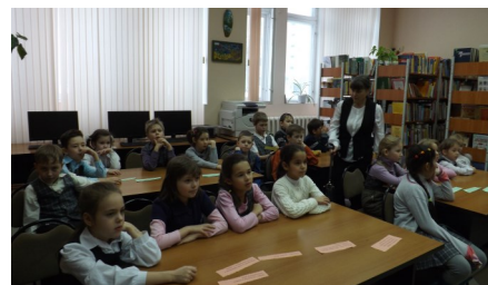
Международный день "Спасибо", 2015 год.