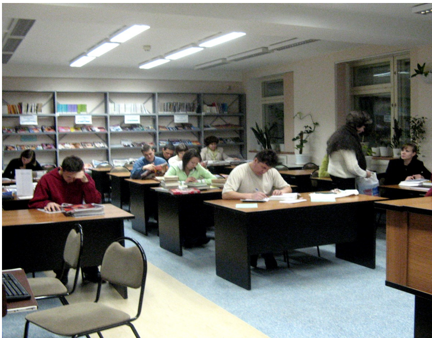
Читальный зал Центральной городской библиотеки

Новые условия труда заставили многих читателей повышать свой профессиональный уровень, приобретать дополнительные специальности. Изменился и расширился спрос студентов и старшеклассников на литературу в помощь учебному процессу. Они запрашивали книги по античной, немецкой, классической, русской и восточной философии, новые материалы по политологии, экономике, экономической географии, государству и праву, новой и новейшей истории. Библиотеки и филиалы продолжают работать по двум направлениям: знакомство с художественной литературой и возрождение семейного чтения. В детской библиотеке организован кукольный кружок.