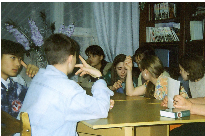
Мероприятие в детской библиотеке (филиал №1)