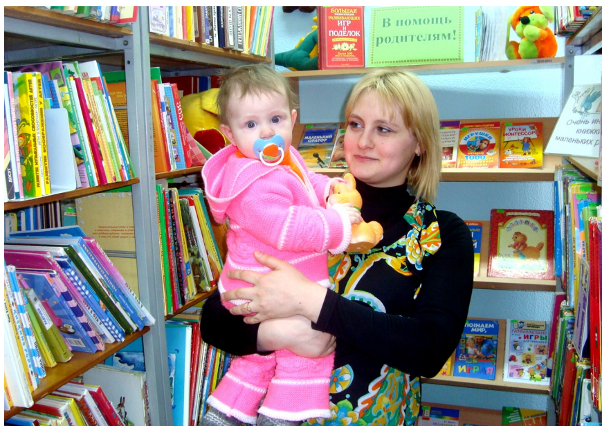
Самый маленький читатель Центральной детской библиотеки

С 2005 года сотрудники детской библиотеки стали издавать книгу читательских рекордов «Почитайка», в которой рассказывали о самых лучших своих читателях.