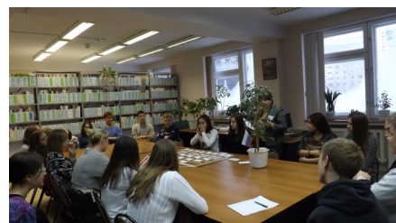
Правовая игра «Дом моей мечты», 2014 год