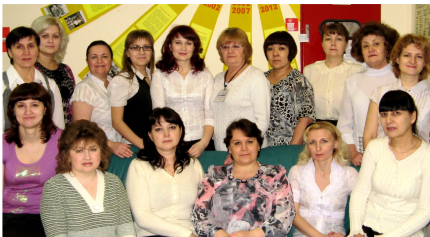
Сотрудники “Библиотечно-информационного центра” 2012 г.

Широкое применение интернета ставит нас в новую информационную ситуацию. Мы видим, что наши пользователи ощущают преимущества интернета, особенно с учетом того, что преобладающее число сайтов бесплатны. И теперь перед нами стоят задачи, которые необходимо решать быстро, эффективно, качественно. Решить надо “не решаемые” проблемы с кадрами, техникой, качеством, чтобы не отстать от современного развития библиотечной жизни. Но порой круговорот событий и мероприятий не дает оглянуться назад. Колесо технического прогресса крутится с каждым годом сильнее, ставя перед нами новые задачи, втягивая в неизбежное самообразование.