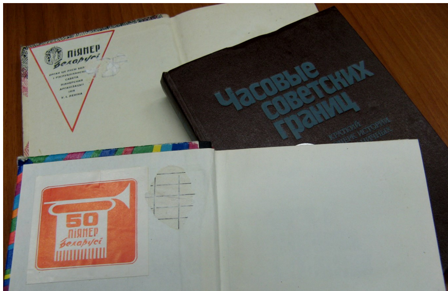
Книги, присланные по акции: «Книги Лангепасу»

В 1983 году белорусская газета: “Піянер Беларусі” №11, в статье: “Кнігі – Лангепасу”, писала: “У далёкім сібярскім краі нашы землякі будуюць новы горад - горад нафтавікоў Лангепас. Ён будзе прыгожым, утульным, светлым, падобным на нашы цудоўныя беларускія гарады. Такім яго бачаць архітэктары... - Руку на дружбу, Лангепас! - гаворым мы сёння. Няхай паміж піянерамі і школьнікамі Беларусі і сібярскага Лангепаса народзіцца моцная дружба! І першым пацвярджэннем сапраўднага сяброўства няхай стане ўдзел піянераў і школьнікаў рэспублікі у АПЕРАЦЫІ “КНІГІ - ЛАНГЕПАСУ!” Калі кожны піянер або піянерское звяно, атрад, дружина падораць юным жыхарам Лангепаса нават па адной кніжцы, - атрымаецца цэлая дзіцячая бібліятэка! Дарагія сябры, адпраўляйце кнігі у Лангепас!”