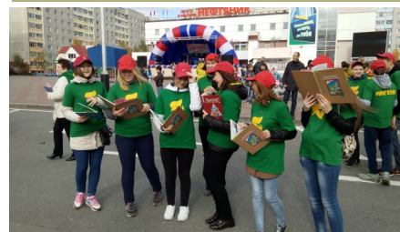
Флешмоб «Читающий город», 2015 год.