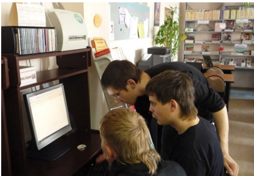
ЦОД: Студенты знакомятся с правовой программой «Консультант+»

Для нас точкой отсчета в правовом просвещении стал сентябрь 2007 года. Именно тогда, в рамках окружной целевой программы «Электронная Югра 2006-2008 гг.», по договоренности с Комитетом по информационным ресурсам администрации Губернатора округа, на базе МУ “БИЦ” открылся “Центр общественного доступа” с машинным парком в 6 единиц, со справочно-правовыми системами: “КонсультантПлюс”, “Кодекс”, “Рубрикон”. Получая оборудование “Центра общественного доступа”, мы даже не подозревали, сколько нам придется учиться. Сегодня с легкой иронией вспоминаем, как учились работать в новом программном обеспечении (новый office, windows Vista 2007). Медленно, но уверенно мы идем вперед.