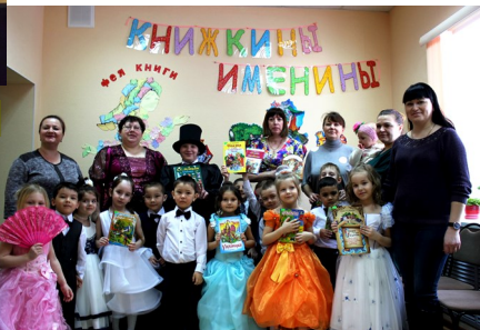
У Пушкина в гостях, 2017 год.