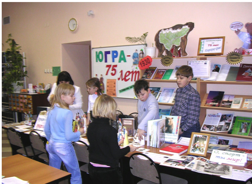
В читальном зале Центральной детской библиотеки

В это же время проводим анкетирование среди читателей об источниках информации. Результат опроса был в пользу книги.